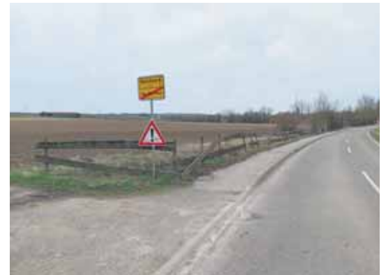
Das „marode“ Geländer in Richtung Wallertheim

nach Gau-Weinheim kurz vorm Ortsschild aufgefallen. Nach Rücksprache mit dem Landkreis und dem LBM in Worms wird dieses Geländer auf einer Länge von ca. 60 m erneuert. In diesem Zuge wird ebenfalls auch die Böschung zum Graben/Bach vollständig ertüchtigt und nachfolgend der Gehweg neu verlegt.