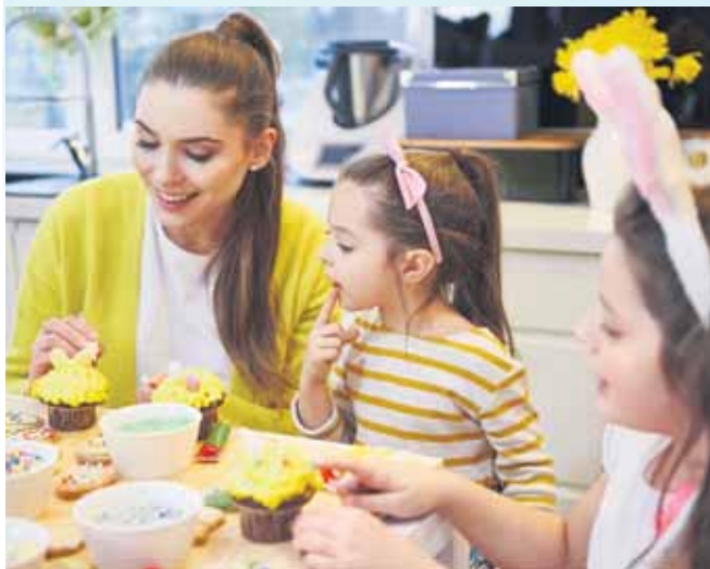
Vielfältige traditionelle Leckereien aus der Osterbäckerei versüßen uns das Osterfest.