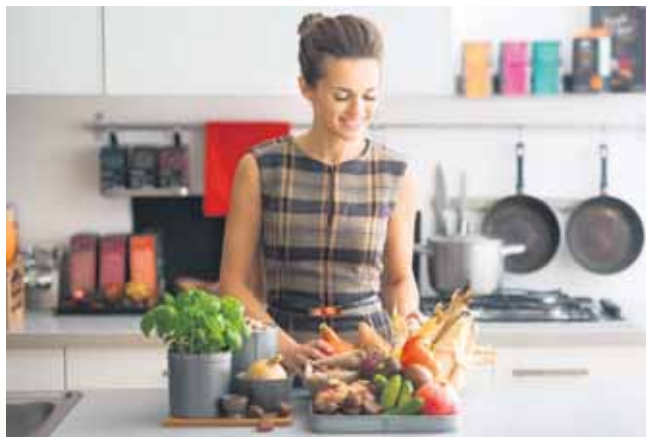
Eine basenüberschüssige Ernährung mit viel Obst, Gemüse und vollwertigem Getreide schafft gute Voraussetzungen für sportliche Leistungskraft.

(DJD). Es geht wieder los: Ob Profi oder ambitionierter Freizeitsportler – mit der warmen Jahreszeit startet auch die Outdoorsaison für Jogger, Kletterer, Kiter, Radler, Fitnessfans und Co. in die nächste Runde. Das ist grundsätzlich gut. Denn Muskeltraining und körperliche Belastungen liefern dem Organismus die erforderlichen Anreize zur Regeneration, zum Erhalt, zur Kräftigung und zur Leistungssteigerung der Gewebe, Muskeln, Sehnen, Bänder, Knorpel und Knochen. Sprich: Ohne Training baut der Körper ab. Es lohnt sich also dranzubleiben.