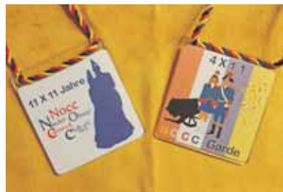
Vorderseite: 11 x 11 Jahre NOCC Rückseite: 4 x 11 Jahre Garde des NOCC

Die Nieder-Olmer Zugplakettchen für das Jahr 2024 stehen zum Kauf bereit. In diesem Jahr werden 2 Jubiläen des Nieder-Olmer Carneval-Clubs als Motivgeber verwendet. Der Club kann in dieser Kampagne auf stolze 11 x 11 Jahre zurückblicken und vor 4 x 11 Jahren wurde die Garde aus der Taufe gehoben. Um dies zu würdigen, verwendet der Hersteller, der Nieder-Olmer Carneval-Verein 1988 e.V., für das große Jubiläum einen Schattenriss des Prinzenpaares und für das der Garde ein Abbild einer Gardistin und eines Gardisten in der traditionellen Uniform vor der „Dickten Berta“, der Konfettikanone, welche beim Sturm auf das Rathaus für den Sieg der Fastnacht sorgt.