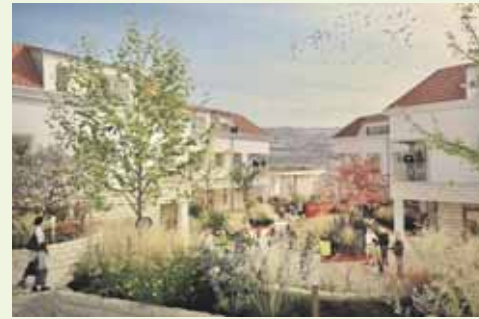
Neue Mitte vom Rathaus aus gesehen

Neujahrsempfang der Ortsgemeinde Essenheim