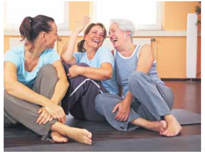
Gemeinsam macht es mehr Spaß: Regelmäßiger schonender Sport wie Yoga oder Gymnastik ist wichtig für die Stärkung des Gelenkknorpels.

(DJD). Die Best Ager ab 50 fühlen sich heute oft deutlich jünger und wollen ihr Leben aktiv genießen. Leider aber können sich gerade in diesem Alter erste Zipperlein bemerkbar machen. Zu den häufigsten Beschwerden gehört hier die Arthrose. Neben herkömmlichen Schmerzmitteln und Physiotherapie ist die ACP-Therapie eine wirksame und sehr gut verträgliche Option. Dabei wird aus Eigenblut gewonnenes plättchenreiches Plasma ins Gelenk gespritzt, wo es den körpereigenen Heilungsprozess anregen, die Knorpelbildung fördern und Entzündungen reduzieren kann. Mehr unter www.acp-therapie.de . Zusätzlich sind regelmäßige Bewegung und gegebenenfalls die Reduktion von Übergewicht ratsam.